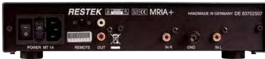
Nichts Weltbewegendes auf der Rückseite: Cinch-Ein- und Ausgänge, dazu eine stabile Erdungsklemme. Mit dem Schalter neben der Kaltgerätebuchse lässt sich die MRIA+ komplett ausschalten

widmen möchte. Dies wird erleichtert durch die extreme Nebengeräuscharmut der Restek und den sehr geringen Klirr, die die Musikwiedergabe vor einem sehr „schwarzen“ Hintergrund sauber freistellt. Ein etwas unangenehmer Nebeneffekt dieser Präzision ist die Unbestechlichkeit, mit der auch übertriebener künstlicher Nachhall überproduzierter Pop- und Rockmusik deutlich hörbar wird – das ist der Preis der Genauigkeit. Auf der Habenseite können wir – übrigens aus genau den gleichen Gründen – eine geradezu fantastische Fähigkeit zur exakten räumlichen Reproduktion der Aufnahme-situation verbuchen – die Wiedergabe ist frappierend realistisch, auch bei noch so