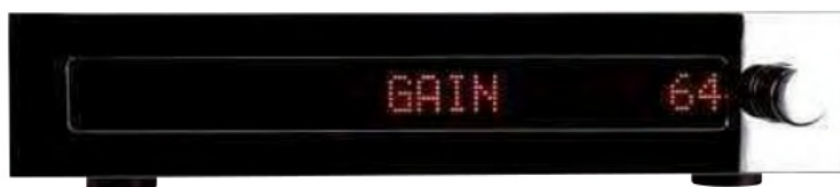
Maximal 64 Dezibel Gain sind drin, das genügt für alle handelsüblichen Tonabnehmer