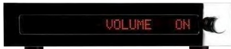
Als besonderes Feature verfügt die MRIA+ über eine regelbare aktive Ausgangsstufe - für den Betrieb als reine Phonostufe ist diese abschaltbar

Im Inneren des Geräts setzt sich der saubere Aufbau fort – auf der klar gegliederten Platine sitzen die extrem rauscharmen Operationsverstärker für die RIAA-Entzerrung und die Ausgangsstufe – ja, der Vorverstärkerausgang ist nicht nur ein abschwächendes Potentiometer, sondern eine aktive Stufe mit elektronischer (und daher fernbedienbarer) Lautstärkeregelung. Nicht ganz so modern, aber ungewein effizient, wird die Anpassung des