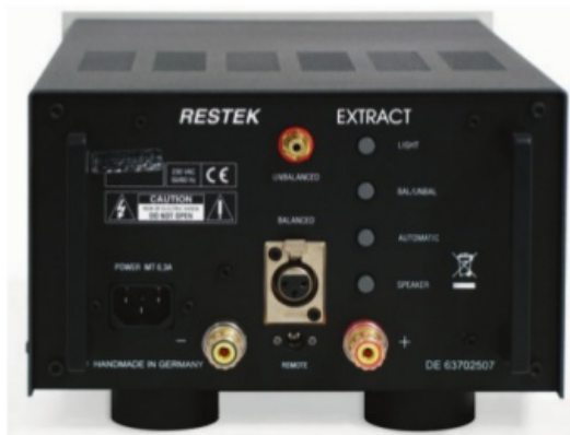
Alles dran, was man so braucht - die Rückseite des Extract

Ein Beispiel für anspruchsvolle tonale Wiedergabe befindet sich auf der CD „Porz Gwenn“ (LÖZ 26) des französischen Pianisten Didier Squiban und hier im Speziellen der Track 4 „Diskan“. Eine