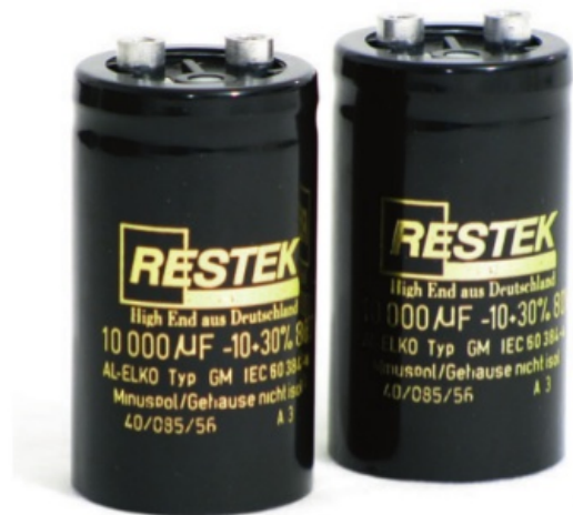
...und die Innereien - auf beides legt man bei Restek gleichermaßen Wert

Die Lautsprecheranschlüsse verfügen über vergoldete Klemmen. Die technischen Daten sind in der Tat beeindruckend: Sinusleistung 180 Watt an 8 Ohm, 300 Watt an 4 Ohm. Der Frequenzgang definiert sich mit 5 Hz - 150 kHz (bei -3 dB). Die Eingangsempfindlichkeit liegt bei 2 V/rms und die Eingangsimpedanz bei 47 kOhm asymmetrisch und 10 kOhm symmetrisch. Die Abmessungen (B x H x T) sind mit 245 x 155 x 395 mm durchaus kompakt und die Gewichtsangabe von ca. 16 kg glaubt man erst dann, wenn die Verstärker beim Auspacken in die Hand genommen werden. Während die Gehäuse in schwarz gehalten sind, kann der Interessent bei der Frontplatte zwischen Acrylglas hochglanzpoliert, Aluminium schwarz, champagner oder silbrig matt gebürstet, alternativ Messing und verchromt wählen. Und wer es in Gold braucht - auch das wird ermöglicht.