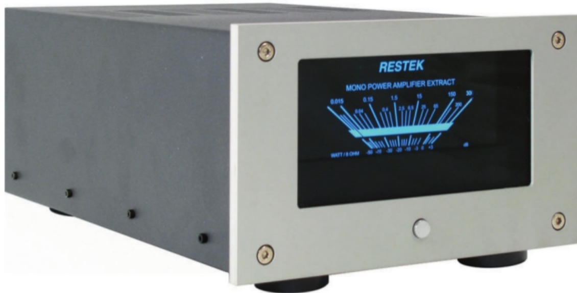
Klein, stark, silber - der Restek „Extract“

dition dieses deutschen Herstellers, der Qualitäts-High-End im Grunde seit der ersten Stunde mitbestimmt hat. Die Tatsache, daß alte Restekgeräte jederzeit technisch - noch dazu für einen fairen Preis (inkl. Garantie) - auf den heutigen Stand gebracht werden können, ist nicht nur kundenfreundlich, vielmehr eher ein Vorzeigebispiel dafür, wie man Nachhaltigkeit ganz selbstverständlich seit Jahren praktiziert. Gerade dieser Fakt sollte m.E. in unserer Wegwerfgesellschaft besonders herausgestellt werden. Ich habe dies bereits vor einiger Zeit selber ausprobiert und bin heute immer noch hochzufrieden mit dem Gerät (Restek-Vorverstärker Vector). Zudem ist das Design über die Jahrzehnte hinweg identisch, was einerseits den Wiedererkennungswert erhält und andererseits dem Besitzer ein zeitloses Gerät beschert. Und so wie die Geräte aussehen, so musizieren sie auch: geradlinig, ohne jegliche Arabesken. Der Restekbesitzer weiß, wenn er seine Anlage einschaltet, erwartet ihn nur die reine Musikwiedergabe des jeweiligen Tonträgers.