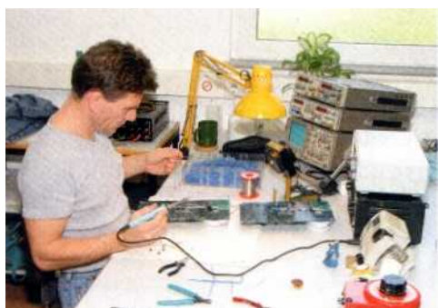
Sieht so ein „Lötröbter“ aus?

Elschoat. - Wenn irgendwo ein UKW-Empfänger allerhöchster Güte gesucht wird, kommt automatisch der Name Restek ins Spiel." Dieser Ruf als führender Spezialist für Empfängertechnologie war Ansporn, sich auch mit Digital Radio zu befassen. - Wir wollten auch in diesem Bereich technologischer Marktführer sein." Das ist gelungen: Der Edab gilt heute in Fachkreisen als Referenz, an der sich andere Empfänger zu messen haben. Anteil an diesem Erfolg haben auch das zeitlose Design und die geniale Einknopf-Bedienung mit einem ausgeklügelten und transparenten Menüsystem. So lassen sich später neue Funktionen hinzufügen, ohne gleich ein Loch für einen zusätzlichen Schalter bohren zu müssen.