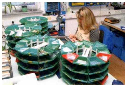
Stückgut: Nur handverlesene Bauteile kommen in Frage.

Die Einführung von Digital Radio sieht Elschoat als Chance für Restek, einmal mehr einen bedeutenden Technologieschritt begleiten zu dürfen. - Es gibt heute weltweit nur rund fünfzehn ernst zu nehmende Empfängerhersteller für Digital Radio." Seit Einführung der Audio-CD vor rund 20 Jahren gab es keine wirklich dramatischen Technologiesprünge im Audiobereich. DVD-Audio und SACD sieht Elschoat lediglich als Variationen eines bereits bestehenden Mediums. MP3 ist für High End ohnehin kein Thema. - Mit der Einführung von Digital Radio findet jetzt wirklich eine Revolution statt. Für uns ist dies zugleich Herausforderung und Chance."